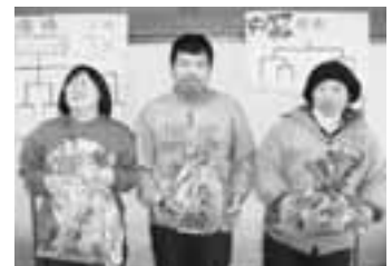
尻相撲は3人が入賞しました!