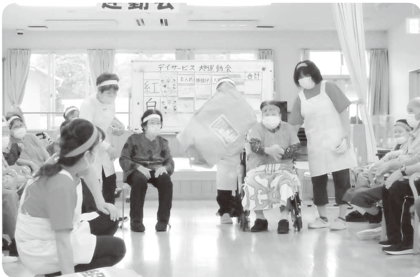
板倉町デイサービスセンターにて 運動会で俵投げ競争をチーム対抗で行いました!!