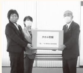
▲東毛法人会女性部会 様